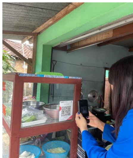
Gambar 4. Dokumentasi Percobaan QRIS.