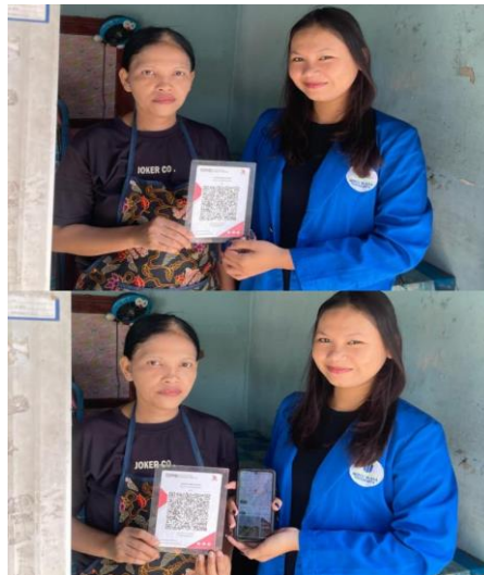
Gambar 3. Dokumentasi Bersama Pemilik Usaha.