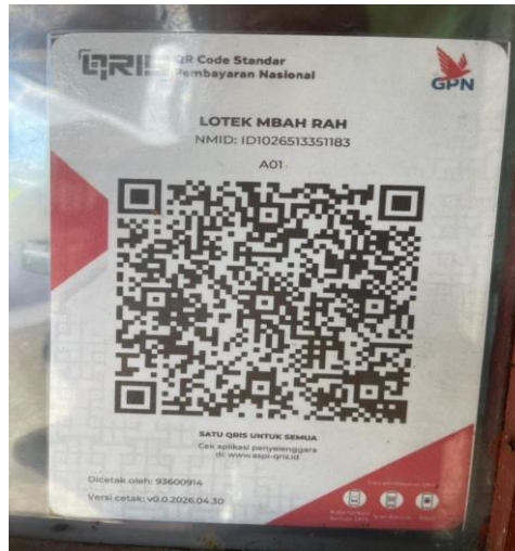
Gambar 2. Hasil Dokumentasi QRIS.