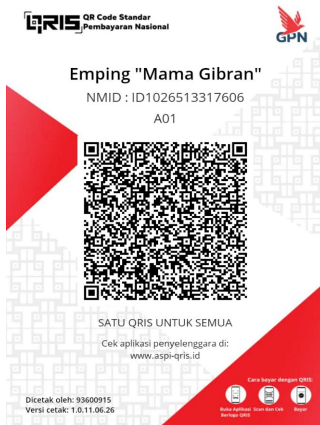
Gambar 3. QRIS UMKM Emping “Mama Gibran”.

Selain penyusunan pembukuan, kegiatan pengabdian juga menghasilkan penerapan sistem pembayaran digital melalui Quick Response Code Indonesian Standard (QRIS). Manfaat QRIS hingga proses pengajuan yang akhirnya menghasilkan QRIS yang siap digunakan oleh UMKM sebagai alternatif pembayaran non-tunai.