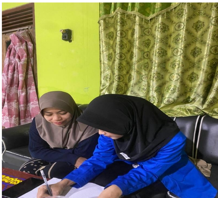
Gambar 2. Pendampingan Penyusunan Pembukuan Sederhana.

Berdasarkan permasalahan yang ditemukan, kegiatan dilanjutkan dengan pendampingan penyusunan pembukuan sederhana. Pendampingan dilakukan melalui praktik pencatatan transaksi secara langsung agar pemilik usaha dapat memahami tahapan penyusunan buku kas hingga penyajian laporan laba rugi sederhana. Selama proses pendampingan, setiap transaksi dicatat sesuai dengan kondisi usaha sehingga pemilik dapat melihat hubungan antara pencatatan transaksi dan informasi keuangan yang dihasilkan.