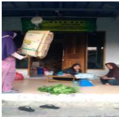
Gambar 2. Sosialisasi dan edukasi masyarakat tentang Bank Sampah.

Kegiatan Pengabdian Masyarakat ini sudah di lakukan sesuai tahap bersama masyarakat, tim Dosen dan Mahasiswa. Pada Gambar 1 dan Gambar 2 adalah jalan nya kegiatan yang dilakukan pada saat: