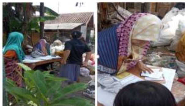
Gambar 3. Kegiatan Masyarakat Tegalsari dalam mengkoordinir Bank sampah.