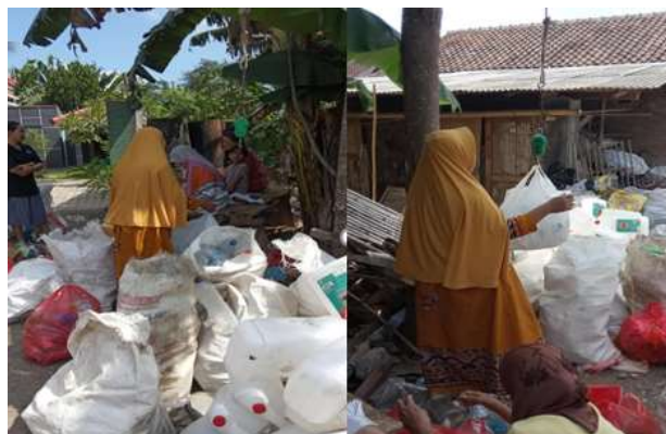
Gambar 4. Pemilahan sampah anorganik untuk bank sampah bersama Warga.