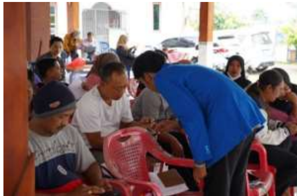
Gambar 5. Dokumentasi Kegiatan.