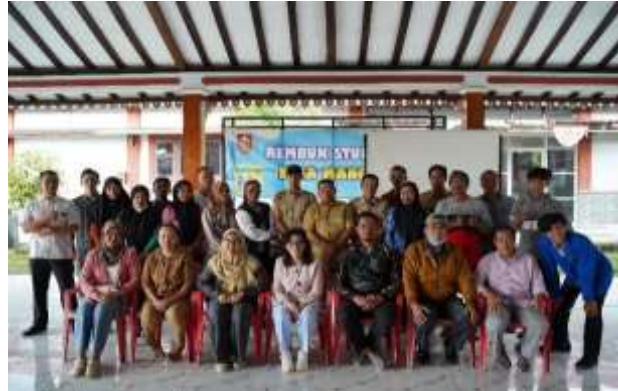
Gambar 6. Dokumentasi Kegiatan.