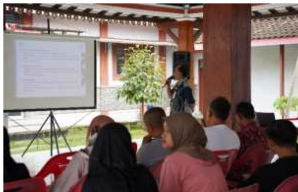
Gambar 7. Dokumentasi Kegiatan.