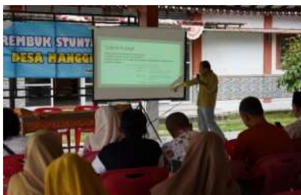
Gambar 2. Dokumentasi Kegiatan.

Ke depan, kegiatan ini memiliki peluang untuk dikembangkan lebih lanjut, misalnya melalui pendampingan lanjutan, integrasi dengan platform marketplace, serta penguatan branding produk lokal secara lebih profesional. Dokumentasi kegiatan berupa foto proses pelatihan, hasil konten peserta, serta tangkapan layar media sosial dapat digunakan sebagai bukti luaran kegiatan sekaligus sebagai bahan evaluasi dan pengembangan program selanjutnya. Dengan demikian, kegiatan pengabdian ini tidak hanya berfungsi sebagai transfer pengetahuan, tetapi juga sebagai upaya pemberdayaan masyarakat yang berkelanjutan berbasis teknologi digital.