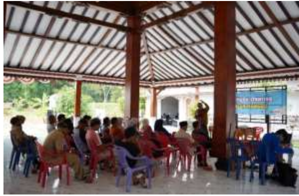
Gambar 4. Dokumentasi Kegiatan.