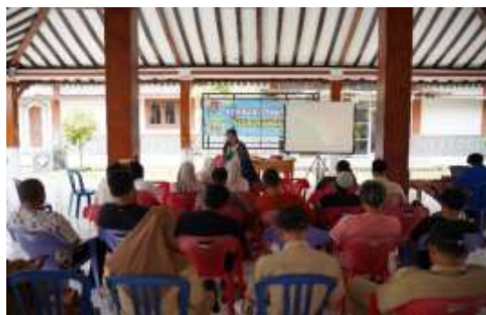
Gambar 3. Dokumentasi Kegiatan.