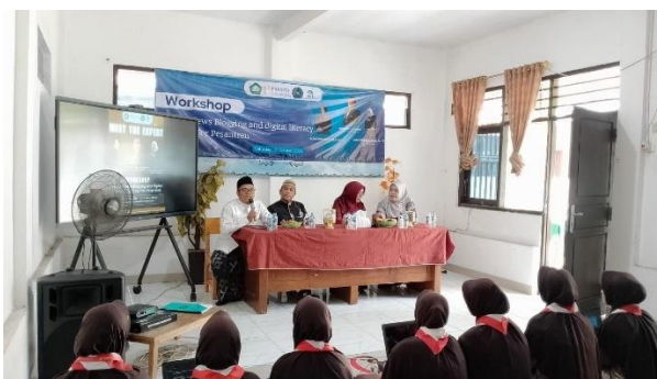
Gambar 2. Pembukaan kegiatan dan penyampaian tujuan pelatihan kepada santri.

Workshop English Journal Writing diberikan sebagai penguatan terhadap kebiasaan menulis. Melalui journaling, santri diajak menulis secara bebas dalam bahasa Inggris tanpa terlalu takut pada kesalahan. Kegiatan ini membantu mengurangi kecemasan menulis dan mendorong santri untuk menjadikan bahasa Inggris sebagai bagian dari refleksi harian. Journaling juga mendukung pembentukan writer identity karena santri diajak menulis tentang pengalaman, kesulitan, tujuan, dan perkembangan diri. Dalam kerangka identitas pembelajar bahasa, kesempatan untuk menggunakan bahasa dalam konteks bermakna dapat membantu pembelajar melihat dirinya sebagai pengguna bahasa yang memiliki suara dan tujuan komunikasi (Darvin & Norton, 2015; Norton, 2013).