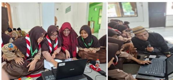
Gambar 4. Pendampingan praktik blogging dan publikasi tulisan santri.