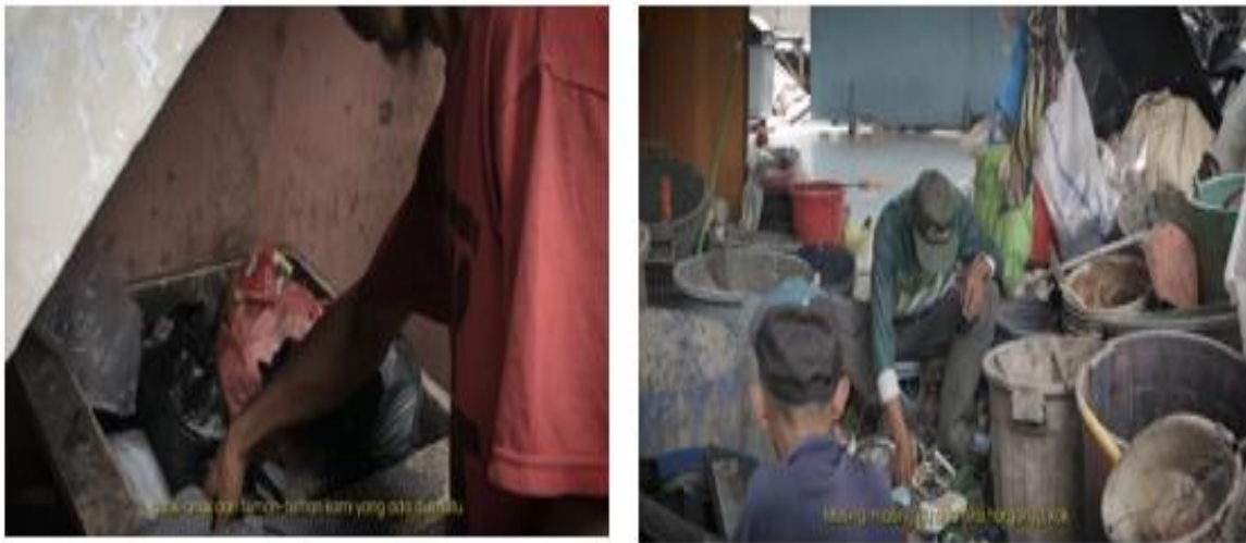
Gambar 3. Sequence 3: Aktivitas Pemulung.

Pada bagian aktivitas, pendekatan ekspositori diterapkan melalui penyusunan alur yang bersifat kronologis dan sistematis. Narasi menjelaskan tahapan kerja pemulung mulai dari proses pencarian sampah, pengumpulan, hingga pengolahan di lapak. Penyusunan yang runtut ini menunjukkan bahwa informasi disampaikan secara logis, sesuai dengan karakteristik pendekatan ekspositori yang bersifat terarah dan argumentatif (Harahap, 2025). Selain itu, wawancara digunakan untuk memperjelas detail aktivitas seperti proses pemilahan berdasarkan jenis sampah dan nilai jualnya. Penyisipan informasi mengenai jenis sampah dominan, seperti plastik, turut memperkuat narasi sebagai bagian dari fakta yang mendukung penjelasan (Damayanti, 2025). Hal ini menunjukkan bahwa pendekatan ekspositori dalam karya ini tidak hanya mengandalkan narasi, tetapi juga mengintegrasikan data dan wawancara dalam membangun pemahaman audiens.