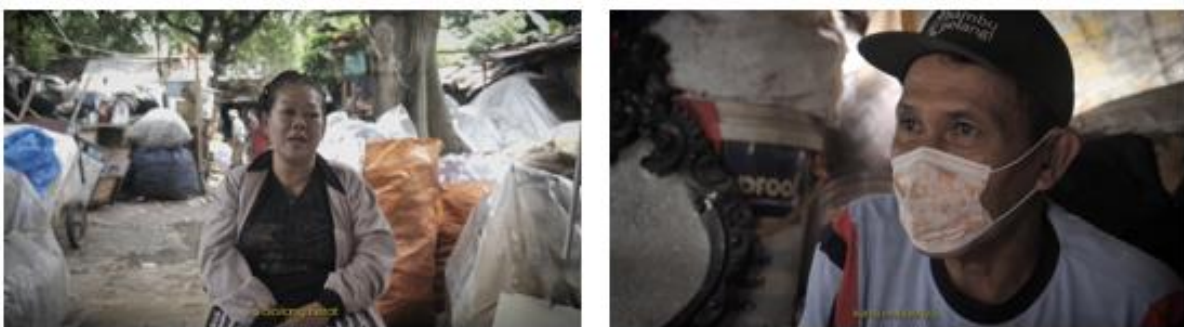
Gambar 5. Sequence 5: Kendala yang Dihadapi.

Pada bagian kendala, pendekatan ekspositori tetap digunakan dengan menghadirkan pengalaman subjektif narasumber melalui wawancara. Narasumber menjelaskan berbagai stigma sosial yang mereka hadapi, seperti tuduhan negatif dari masyarakat. Meskipun bagian ini mengandung unsur emosional, penyampaian tetap dilakukan secara verbal dan terarah sehingga tetap berada dalam kerangka ekspositori. Hal ini menunjukkan bahwa pendekatan ekspositori tidak hanya digunakan untuk menyampaikan fakta objektif, tetapi juga mampu