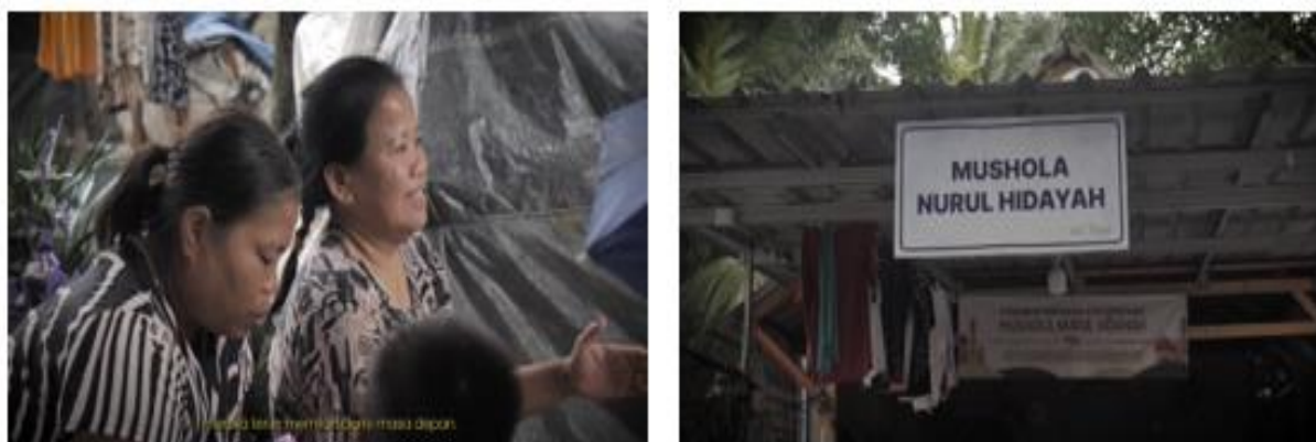
Gambar 7. Sequence 7: Penutup.