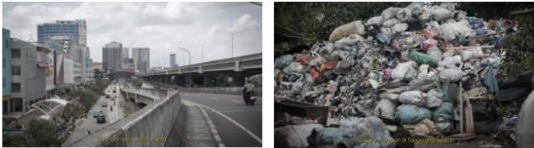
Gambar 1. Sequence 1: Prolog.

Pada bagian prolog, pendekatan ekspositori dalam bagian ini tercermin melalui penggunaan voice over yang secara langsung membingkai isu utama mengenai permasalahan sampah. Narasi pembuka yang menggambarkan hubungan antara aktivitas manusia dan sisa yang dihasilkan berfungsi sebagai landasan awal dalam membangun pemahaman audiens terhadap fenomena yang diangkat. Penyisipan data mengenai jumlah timbulan sampah di wilayah Tangerang Selatan memperkuat narasi sehingga tidak hanya bersifat deskriptif, tetapi juga argumentatif (Damayanti, 2025). Visual yang menampilkan aktivitas kota dan tumpukan sampah berperan sebagai ilustrasi yang mendukung penjelasan verbal, sehingga hubungan antara gambar dan narasi bersifat komplementer. Pada bagian ini, arah penyampaian sudah ditentukan sejak awal melalui narasi yang terstruktur, sesuai dengan karakteristik pendekatan ekspositori (Harahap, 2025).