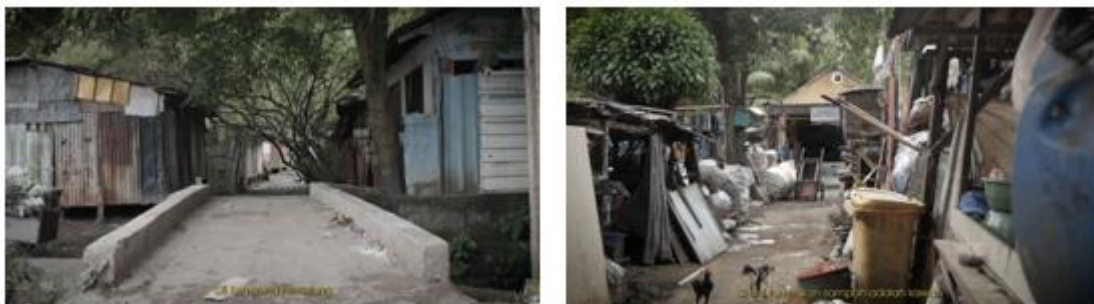
Gambar 2. Sequence 2: Pengenalan Kampung Pemulung.